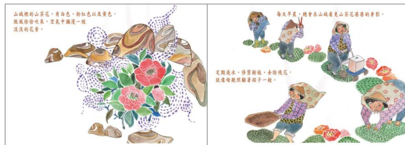
※範例作品：教育部反毒繪本—山茶花婆婆/洪孟真、呂舒婷